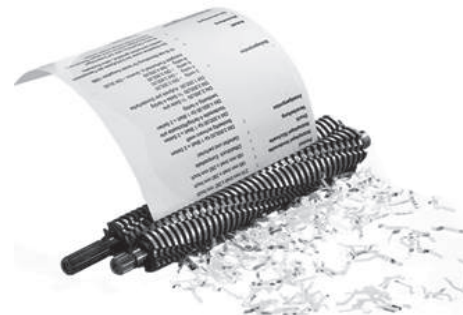
◀ 꽃가루형 칼날